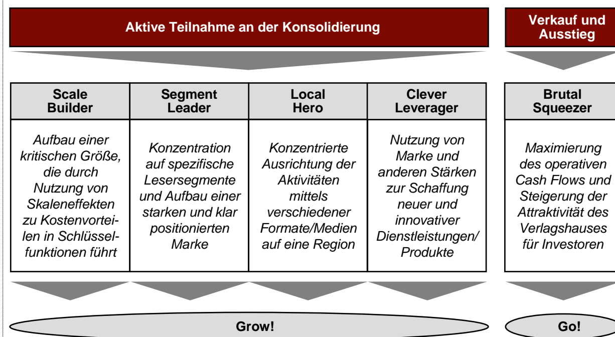
Grafik III: Strategische Optionen im bevorstehenden Newspaper Endgame

Die Strategie des Segment Leader , der sich auf genau abgegrenzte Angebote und Leserzielgruppen konzentriert, bietet auch kleineren Verlagshäusern gute Chancen, den bevorstehenden Kampf auf dem Zeitungsmarkt zu überleben. Erfolgreiche Beispiele in Frankreich sind die christliche Tageszeitung La Croix oder die täglich erscheinende Wirtschaftszeitung Les Echos, die durch ihre konsequente Ausrichtung auf spezielle Lesersegmente und das