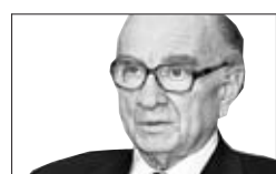
Otto Graf Lambsdorff

In der Krise waren die Eingriffe des Bundes alternativlos. Doch nun ist Umdenken angesagt