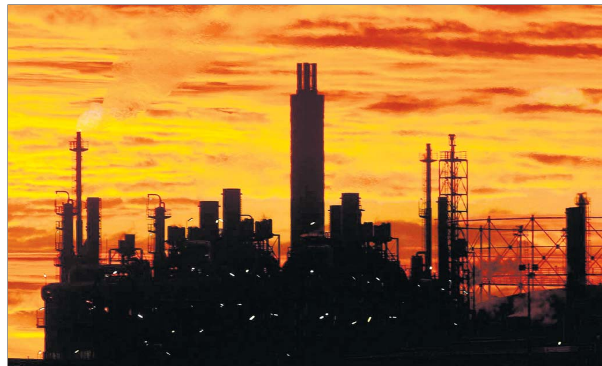
BASF in Ludwigshafen ist der größte Chemiekonzern der Welt – doch neue Konkurrenz aus Asien und dem Nahen Osten wird die deutsche Industrie in den kommenden Jahren unter Druck setzen

Problematisch hingegen ist die Gefahr, dass sich kurzfristig angelegte Eingriffe zu einem staatsinterventionistischen Modell verfestigen.