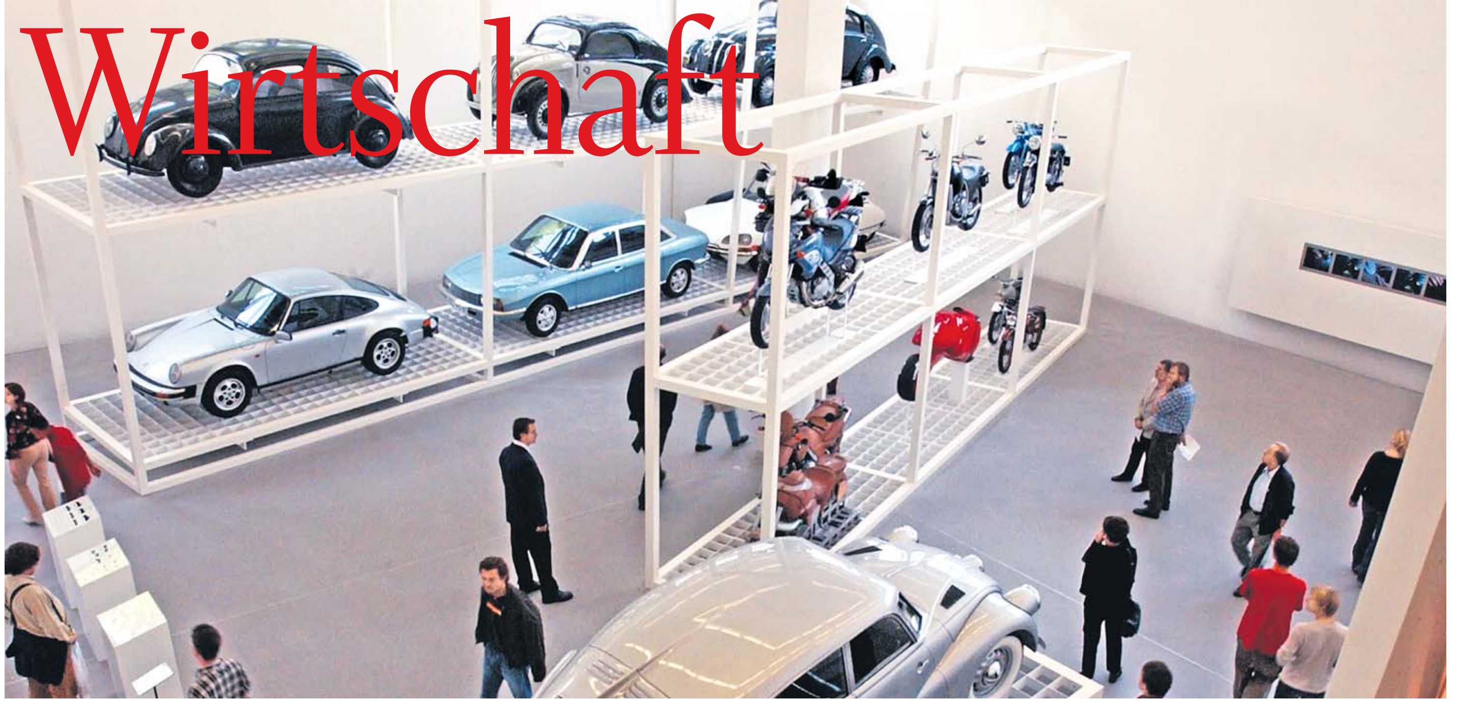
Designabteilung der Pinakothek der Moderne in München: Auch in Zukunft werden traditionell starke Branchen wie der Automobilbau in Deutschland eine zentrale Rolle für das Wirtschaftswachstum spielen